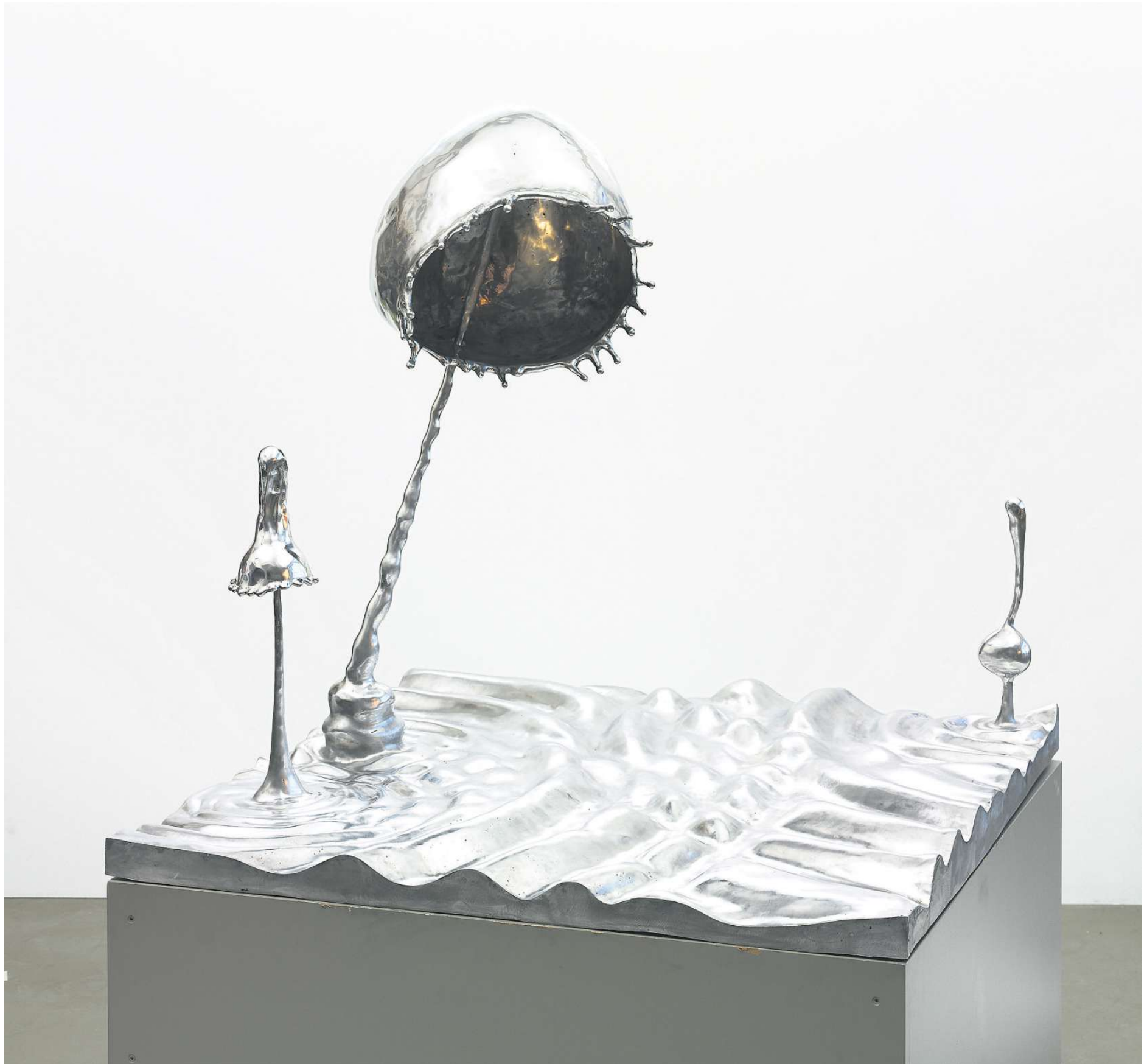
Anna Bogouchevskaia, „Tropfen Motiv 10“ (91 x 98 x 55 cm) von 2018, Aluminium